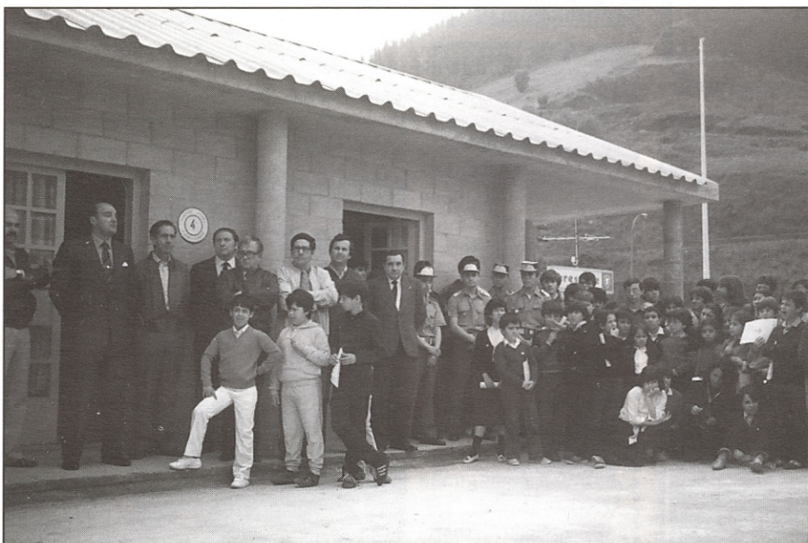
Sallabenteko Sorostetxearen inaugurazio argazkia.