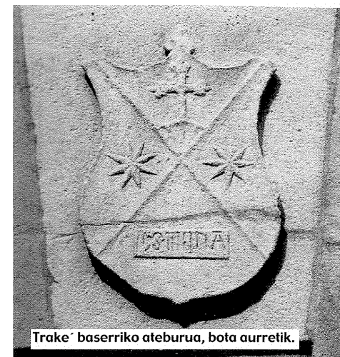
Trake baserrion ateburua, bota aurretik.