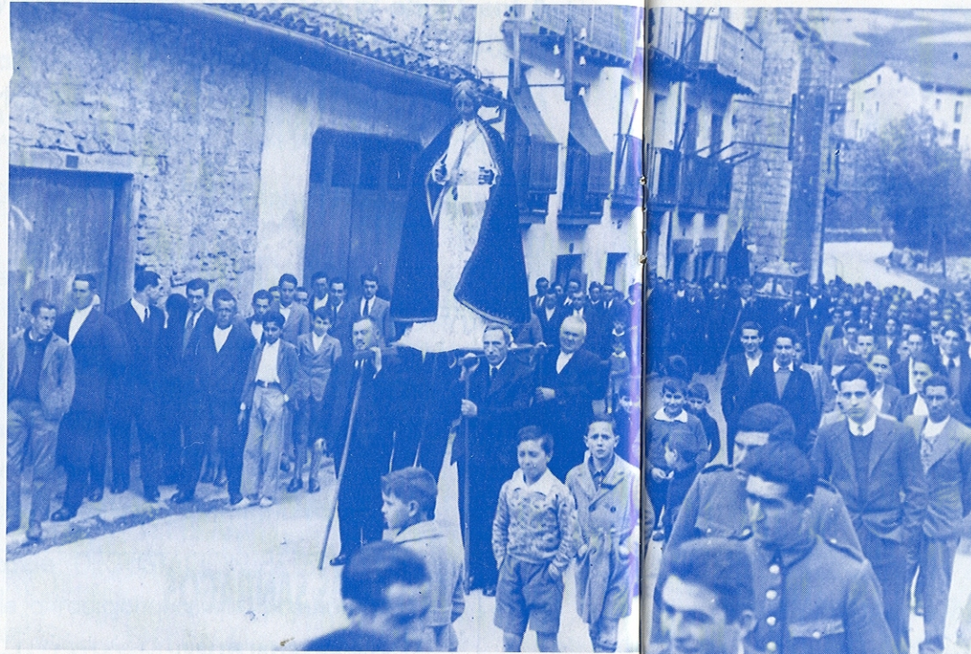
Desfile procesional por la calle Marqués de Valdespina en 1932.

Tiene por armas la Villa de Ermua, en su Casa Consistorial, un escudo de bronce amarillo partido en tres cuarteles. En el de la derecha, el Arbol de Guernica con dos lobos cruzados horizontalmente mirando hacia fuera, los lobos son negros y están cebados, con dos corderos sangrientos en campo de plata; en la izquierda y en la parte superior, una media luna con las puntas hacia abajo en plata con fondo dorado y, en la parte inferior, una cadena en forma de media luna con dos estrellas de seis puntas perpendiculares, ambas de bronce, con fondo plateado. Rematando el escudo en la parte