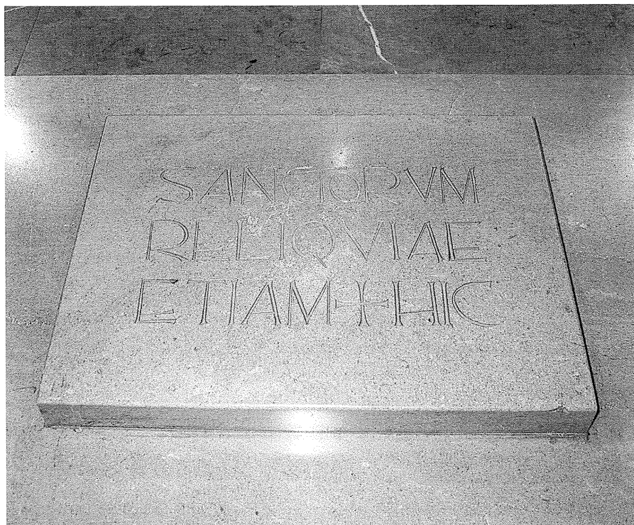
Elizaren altarpian daoz errelikiak.

1965. urtian Batikanoren II. Kontziliuak liturgia arau barrixak erabaki zitxuan, tartian mezia aurrez-aurre fededunei begira emon bihar zala eta ez lepua emonda. Honek parrokixako altara nagusixa egokitzeko premiñia ekarri eban; barriztapenak aprobetxau