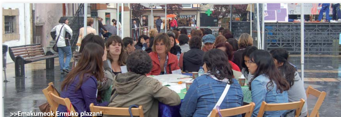
>>Emakumeek Ermuko plazan!

Ikasleentzako ikastaro kalitatezkoak eta interesgarriak antolatzeaz gain, lau eskolen arteko topaketak egiten dira ikasturtean zehar, bakoitzean herri baten, emakumeen partaidetza soziopolitikoarekin eta jabekuntzarekin zerikusia duten gaietan sakontzeko.